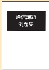
通信課題例題集 (模範解答付き)